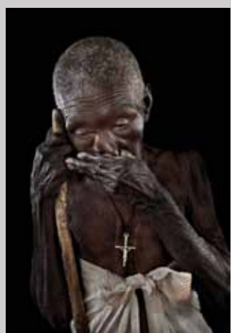
47 Raymond Rutting Noord-Oeganda, vluchteling print 50 x 70 cm, incl. lijst vanaf € 250,-