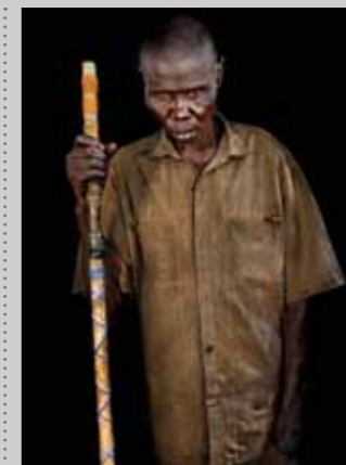
35 Raymond Rutting Zuid-Soedan, Lowrencio Kulang print 50 x 70 cm, incl. lijst vanaf € 250,-