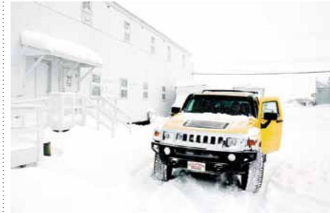
17 Sacha de Boer Hummer in sneeuw print 60 x 70 cm, incl. lijst vanaf € 250,-