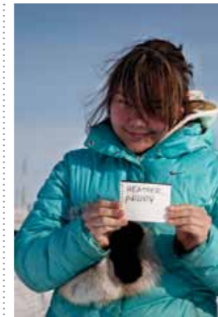
21 Sacha de Boer Kind in sneeuw 2 print 60 x 70 cm, incl. lijst vanaf € 250,-