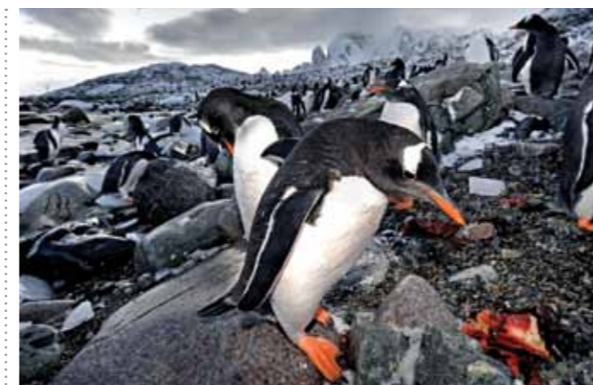
31 Raymond Rutting Cuverville Island print 60 x 70 cm, incl. lijst vanaf € 250,-