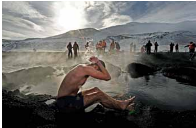
04 Raymond Rutting Deception Island print 60 x 70 cm, incl. lijst vanaf € 250,-