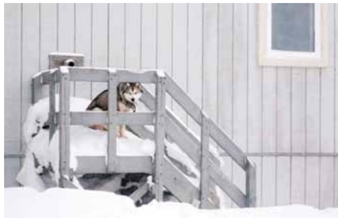
15 Sacha de Boer Poolhond 1 print 60 x 70 cm, incl. lijst vanaf € 250,-