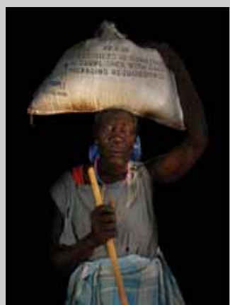
39 Raymond Rutting Zuid-Soedan, Juba print 50 x 70 cm, incl. lijst vanaf € 250,-