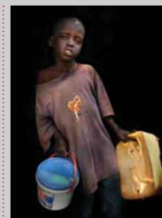
58 Raymond Rutting Oog op Afrika canvas 80 x 50 cm, incl. lijst vanaf € 800,-