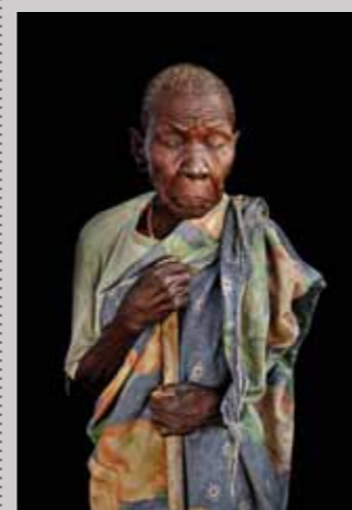
59 Raymond Rutting Oog op Afrika canvas 100 x 150 cm, incl. lijst vanaf € 1.500,-