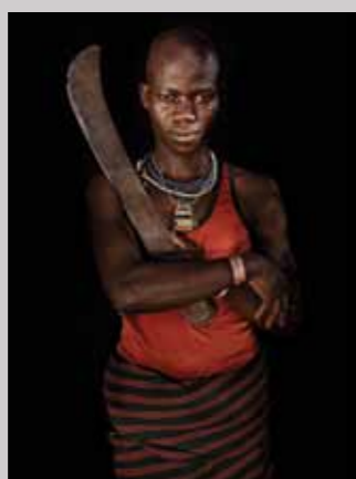
44 Raymond Rutting Oeganda, Pedter Alejoi print 50 x 70 cm, incl. lijst vanaf € 250,-