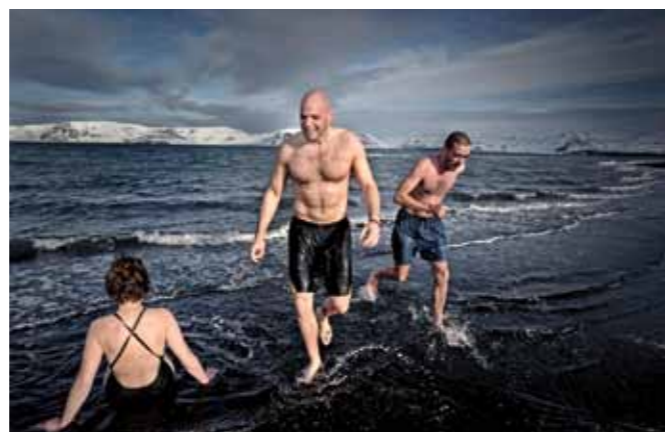
30 Raymond Rutting Zwemmen op Antarctica print 60 x 70 cm, incl. lijst vanaf € 250,-