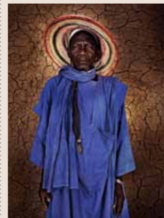
77 Raymond Rutting Mali faces print op canvas 120 x 70 cm vanaf € 500,-