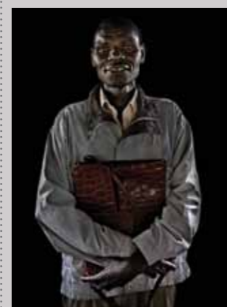
56 Raymond Rutting Noord-Oeganda, vluchteling print 50 x 70 cm, incl. lijst vanaf € 250,-