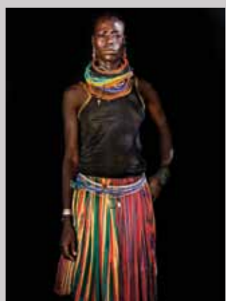
43 Raymond Rutting Oeganda, Angela Nawat print 50 x 70 cm, incl. lijst vanaf € 250,-