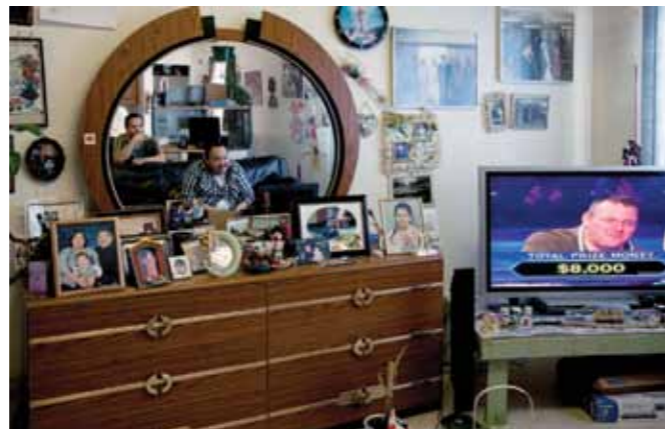
16 Sacha de Boer Weekend Miljonairs print 60 x 70 cm, incl. lijst vanaf € 250,-