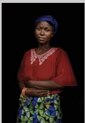
49 Raymond Rutting Oost-Congo, Mlebinge Wilondja print 50 x 70 cm, incl. lijst vanaf € 250,-