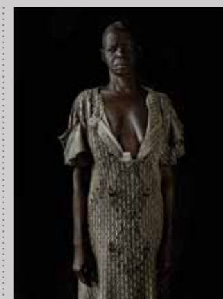
53 Raymond Rutting Soedan, Santina Teraka Lomeling print 50 x 70 cm, incl. lijst vanaf € 250,-