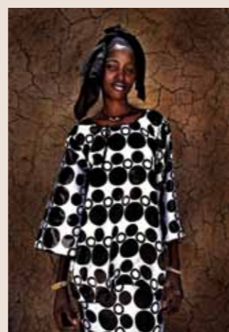
76 Raymond Rutting Mali faces print op canvas 120 x 70 cm vanaf € 500,-