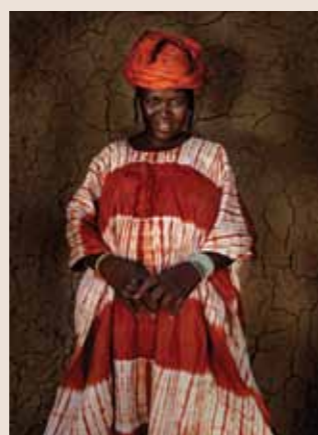
71 Raymond Rutting Mali faces print op canvas 120 x 70 cm vanaf € 500,-