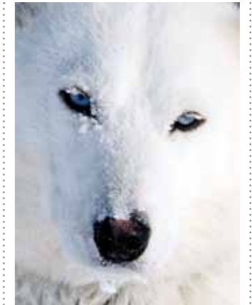
19 Sacha de Boer Poolhond 2 print 60 x 70 cm, incl. lijst vanaf € 250,-