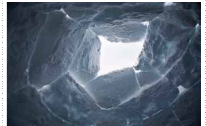
24 Sacha de Boer Iglo 2 print 60 x 70 cm, incl. lijst vanaf € 250,-