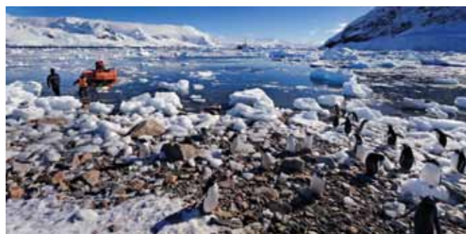
29 Raymond Rutting Neko Harbour print 60 x 70 cm, incl. lijst vanaf € 250,-