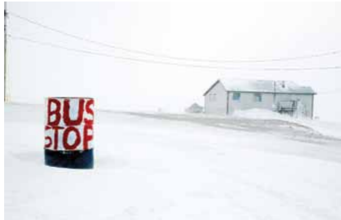
11 Sacha de Boer Gjoa haven. Busstop print 60 x 70 cm, incl. lijst vanaf € 350,-