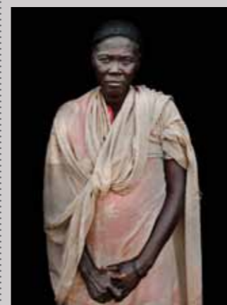
51 Raymond Rutting Zuid-Soedan, Sabine Djokuda print 50 x 70 cm, incl. lijst vanaf € 250,-