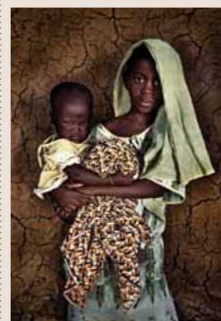
82 Raymond Rutting Mali faces print op canvas 120 x 70 cm vanaf € 750,-