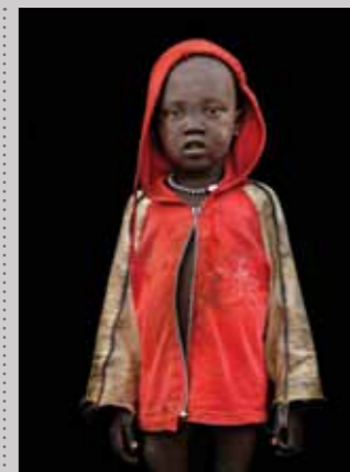
36 Raymond Rutting Zuid-Soedan, Jay print 50 x 70 cm, incl. lijst vanaf € 250,-