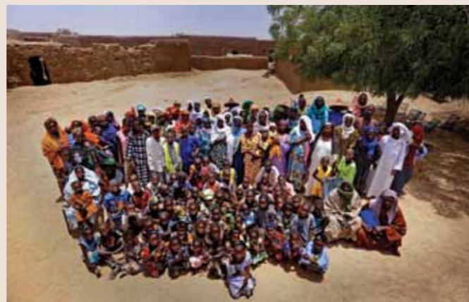
70 Raymond Rutting Mali, het dorp Morikaira print op canvas 120 x 70 cm vanaf € 500,-