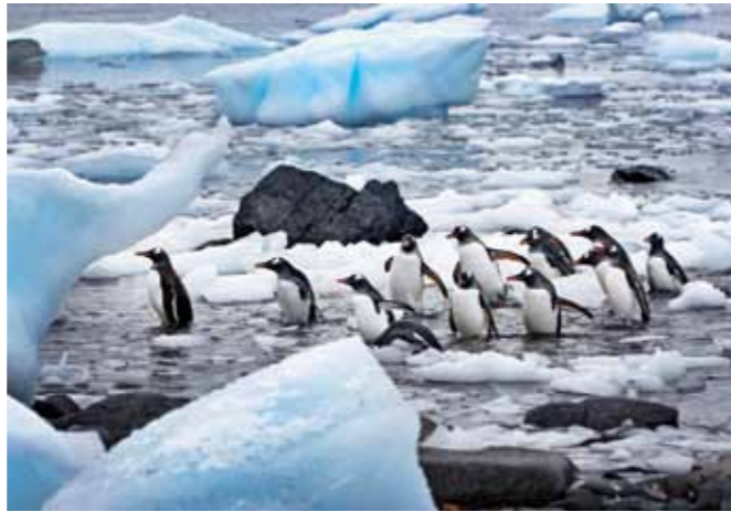
02 Raymond Rutting Danco Island print 60 x 70 cm, incl. lijst vanaf € 250,-