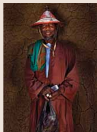
72 Raymond Rutting Mali faces print op canvas 120 x 70 cm vanaf € 500,-