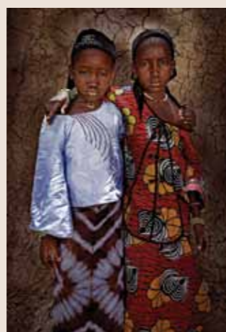
75 Raymond Rutting Mali faces print op canvas 120 x 70 cm vanaf € 500,-