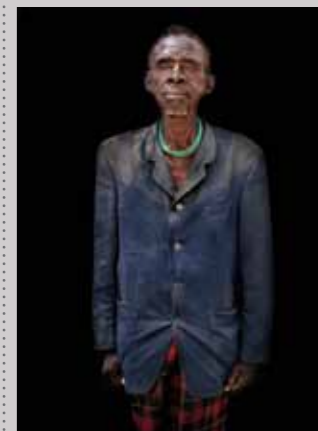
38 Raymond Rutting Oeganda, Loporon print 50 x 70 cm, incl. lijst vanaf € 250,-