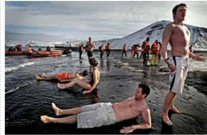
05 Raymond Rutting Deception Island print 60 x 70 cm, incl. lijst vanaf € 250,-