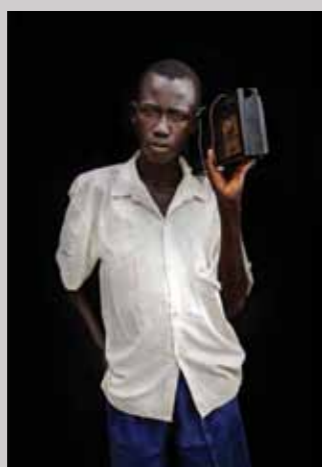
48 Raymond Rutting Noord-Oeganda, Olia Dickens print 50 x 70 cm, incl. lijst vanaf € 250,-