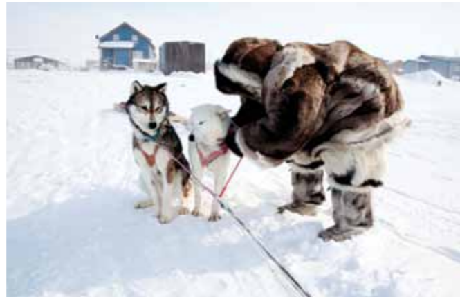
12 Sacha de Boer Traditionele jager print 60 x 70 cm, incl. lijst vanaf € 350,-