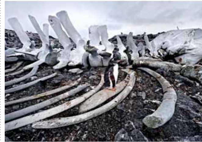
07 Raymond Rutting Port Lockroy print 60 x 70 cm, incl. lijst vanaf € 250,-