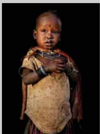
41 Raymond Rutting Oeganda, Naupe Lokuam print 50 x 70 cm, incl. lijst vanaf € 250,-