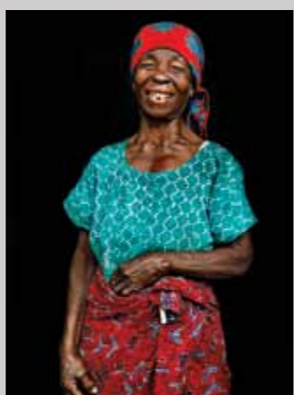
45 Raymond Rutting Oost-Congo, Fayza Machici print 50 x 70 cm, incl. lijst vanaf € 250,-