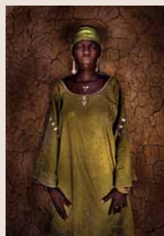
73 Raymond Rutting Mali faces print op canvas 120 x 70 cm vanaf € 500,-