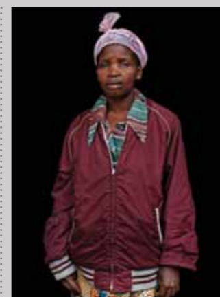
52 Raymond Rutting Oost-Congo, Amina Amisi print 50 x 70 cm, incl. lijst vanaf € 250,-