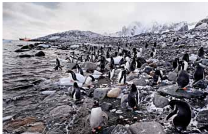
25 Raymond Rutting Cuverville Island print 60 x 70 cm, incl. lijst vanaf € 250,-