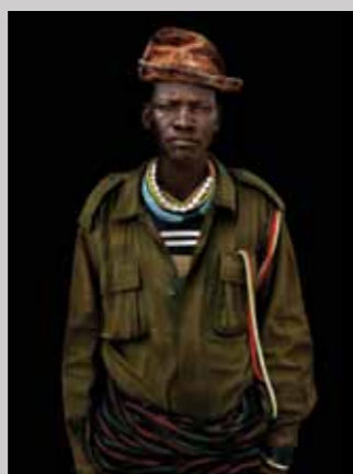
40 Raymond Rutting Oeganda, Nangiro print 50 x 70 cm, incl. lijst vanaf € 250,-