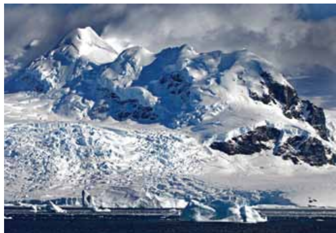
27 Raymond Rutting Danco Island print 60 x 70 cm, incl. lijst vanaf € 250,-