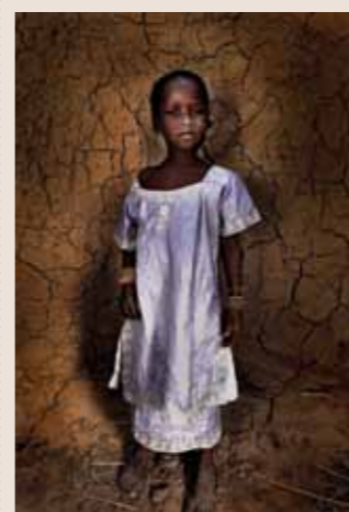
83 Raymond Rutting Mali faces print op canvas 120 x 70 cm vanaf € 500,-