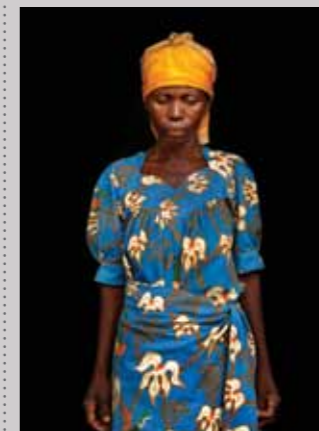
37 Raymond Rutting Oost-Congo, Maria N'ebuca print 50 x 70 cm, incl. lijst vanaf € 250,-