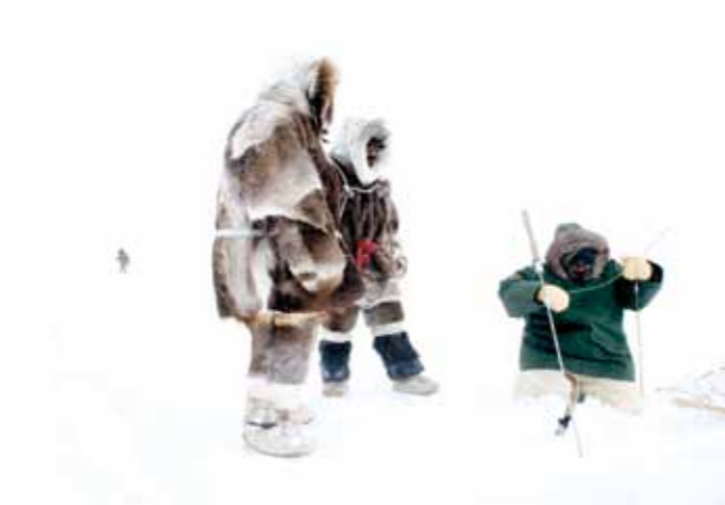
14 Sacha de Boer Traditioneel jagen print 60 x 70 cm, incl. lijst vanaf € 250,-