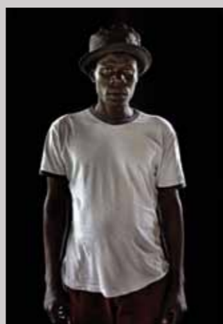
50 Raymond Rutting Noord-Oeganda, vluchteling print 50 x 70 cm, incl. lijst vanaf € 250,-