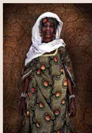
74 Raymond Rutting Mali faces print op canvas 120 x 70 cm vanaf € 500,-