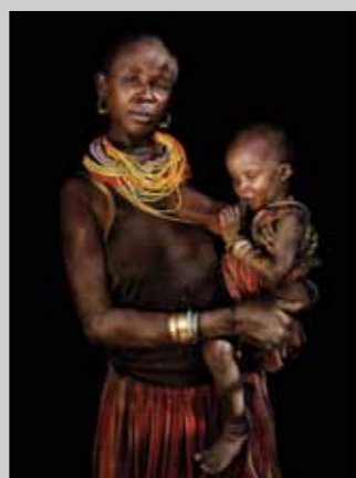
42 Raymond Rutting Oeganda, Veronica Lokuam print 50 x 70 cm, incl. lijst vanaf € 250,-