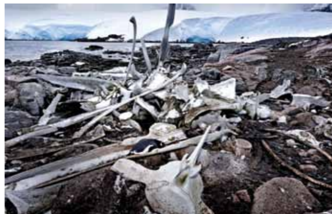
26 Raymond Rutting Port Lockroy print 60 x 70 cm, incl. lijst vanaf € 250,-