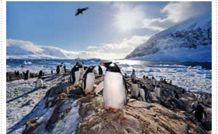
10 Raymond Rutting Neko Harbour print 60 x 70 cm, incl. lijst vanaf € 350,-