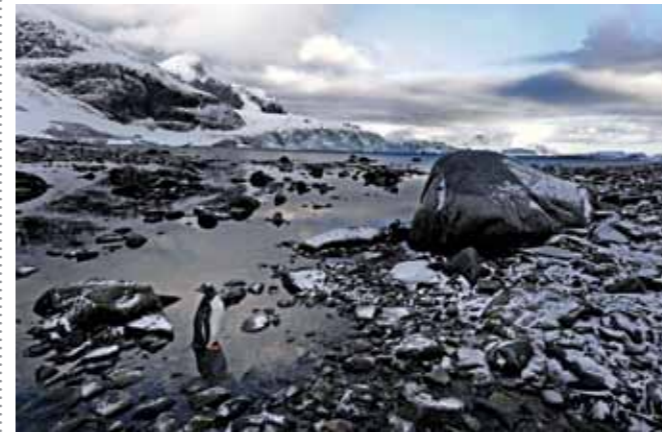
09 Raymond Rutting Cuverville Island print 60 x 70 cm, incl. lijst vanaf € 250,-