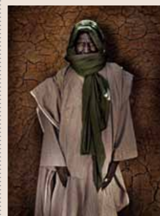
79 Raymond Rutting Mali faces print op canvas 120 x 70 cm vanaf € 500,-