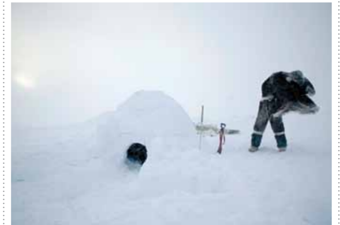
22 Sacha de Boer Iglo 1 print 60 x 70 cm, incl. lijst vanaf € 250,-