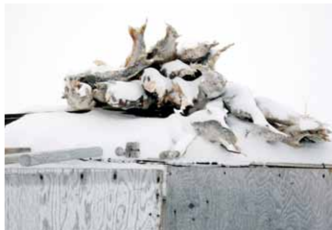
28 Sacha de Boer Visvoorraad print 60 x 70 cm, incl. lijst vanaf € 250,-