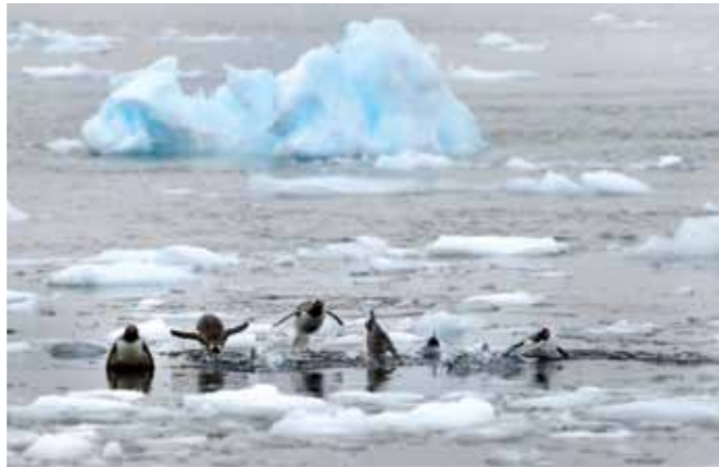
01 Raymond Rutting Danco Island print 60 x 70 cm, incl. lijst vanaf € 250,-