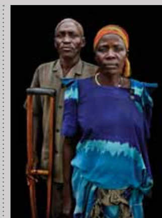
54 Raymond Rutting Oeganda, Eujenio en Semmy print 50 x 70 cm, incl. lijst vanaf € 250,-