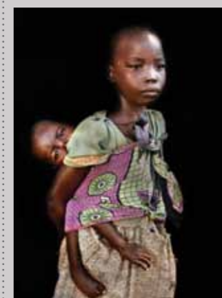
57 Raymond Rutting Soedan, Ilotofu en Titamaka print 50 x 70 cm, incl. lijst vanaf € 250,-