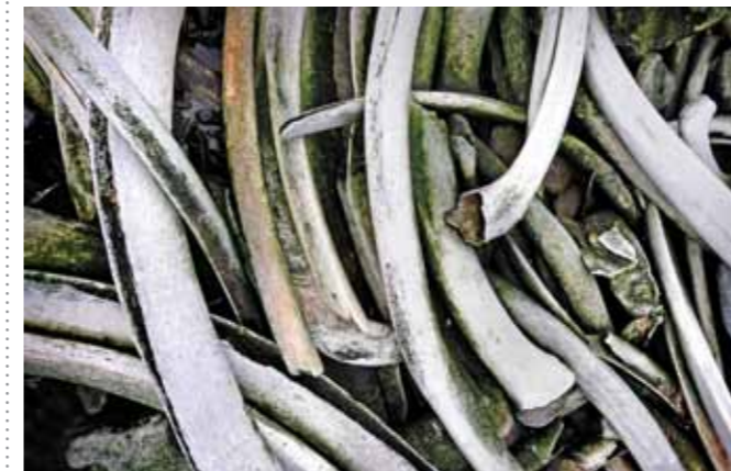
23 Raymond Rutting Walvis skelet print 60 x 70 cm, incl. lijst vanaf € 250,-