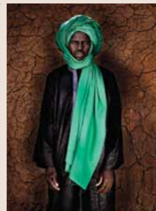
78 Raymond Rutting Mali faces print op canvas 120 x 70 cm vanaf € 750,-