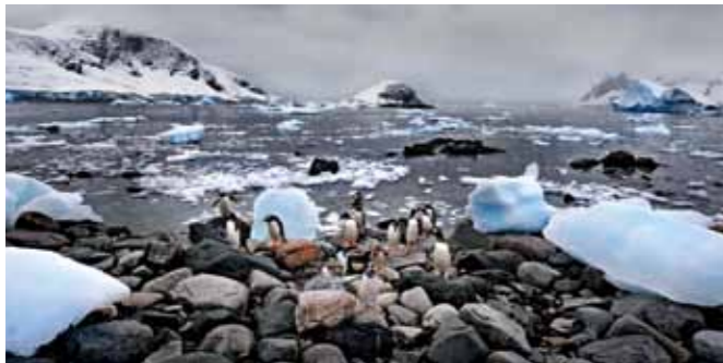
03 Raymond Rutting Danco Island print 60 x 70 cm, incl. lijst vanaf € 250,-