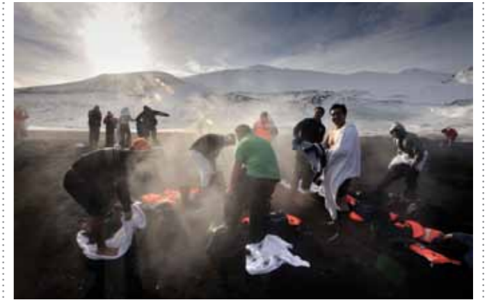
06 Raymond Rutting Deception Island print 60 x 70 cm, incl. lijst vanaf € 250,-