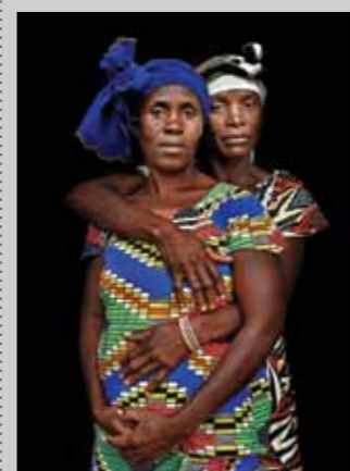
55 Raymond Rutting Oost-Congo, Tatu en Perpetwa print 50 x 70 cm, incl. lijst vanaf € 250,-