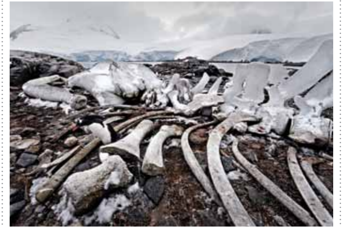
08 Raymond Rutting Port Lockroy print 60 x 70 cm, incl. lijst vanaf € 250,-